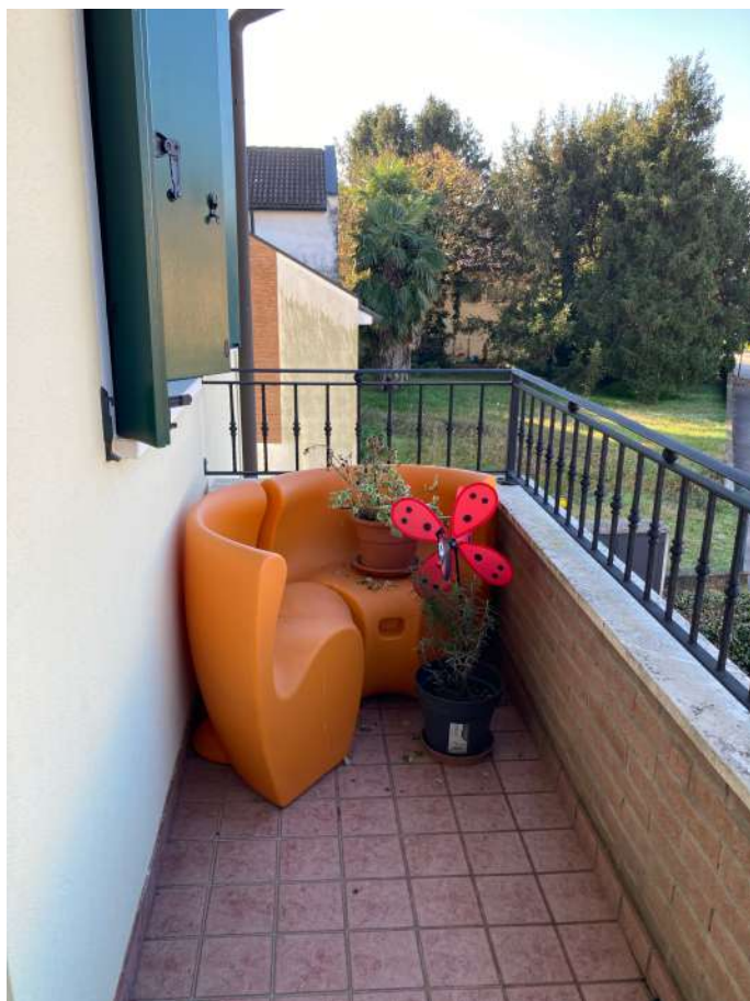
Vista esterna: terrazza; vista interna: camera matrimoniale