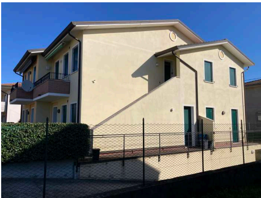
Viste dell'immobile condominiale da via Foscolo