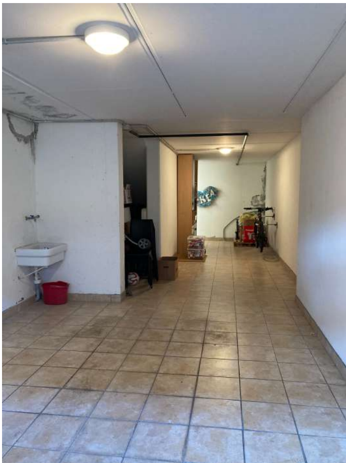
Viste interne: autorimessa e particolari delle parti ammalorate