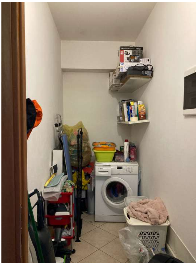
Viste interne: Ripostiglio