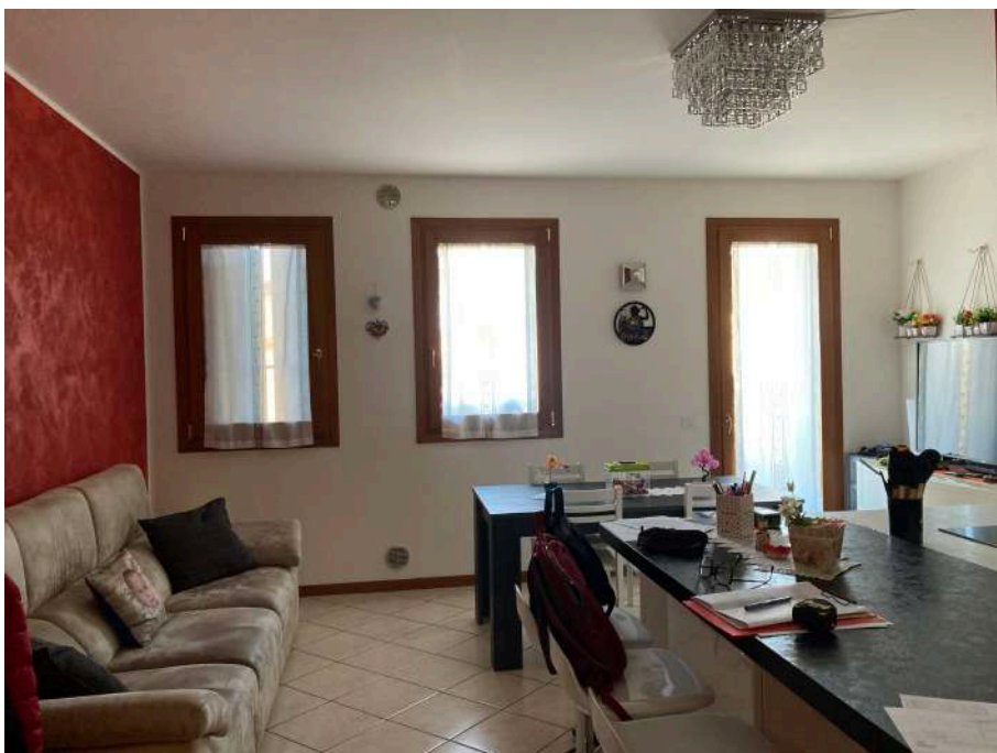
Viste interne: vano soggiorno e cucina