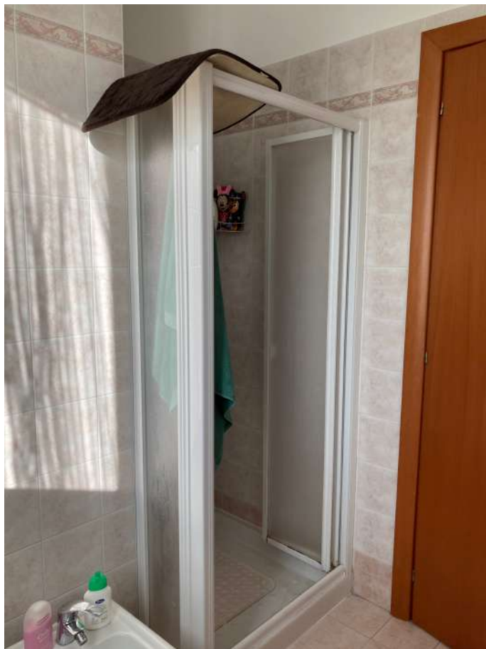
Viste interne: servizio igienico e corridoio