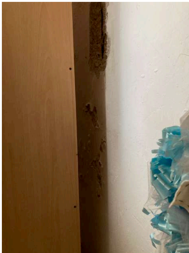
Viste interne: particolari delle parti ammalorate nell' autorimessa