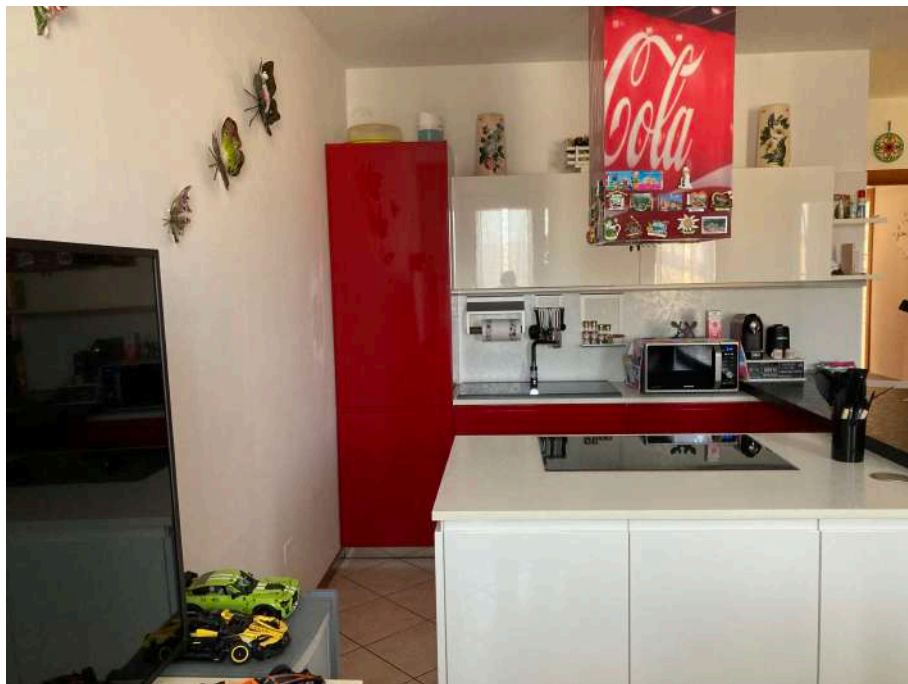
Vista interna: zona cucina