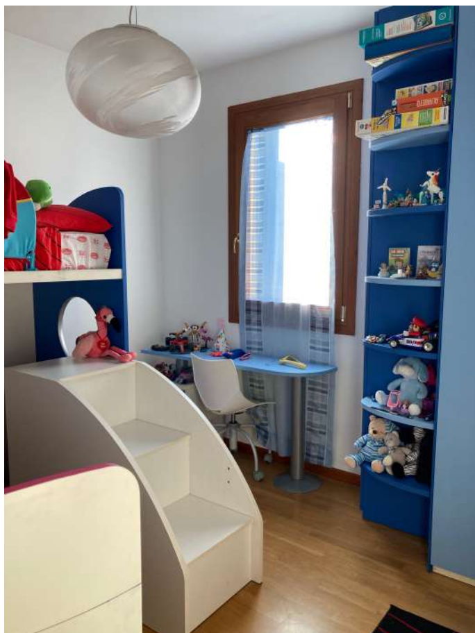
Viste interne: camere e servizio igienico